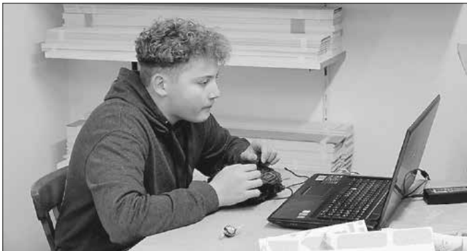
Absturzfrees Fliegen am Flugsimulator, damit in der kommenden Saison möglichst wenig passiert.