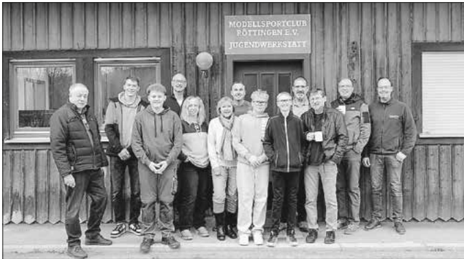
Endlich geschafft! Zufriedene Mienen bei der Jugend- und Renovierergruppe. Leider sorgte die Grippewelle für einige Ausfälle auf dem Foto.

Noch ein Hinweis an gewisse Mitbürger: Ein Modellflugplatz ist keine Rallyepiste!!!! Wenn es unbedingt sein muss, dann tobt euch auf der eigenen Wiese oder in eurem Garten aus! Wer lesen kann, sollte auch wissen, dass der Platz videoüberwacht ist – also ist mit einer Anzeige zu rechnen! Die Vorstandschaft