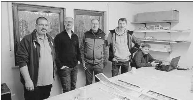
Jetzt kann es losgehen! Die ersten Rohbauten liegen bereit und alle freuen sich über die perfekt renovierte Werkstatt.